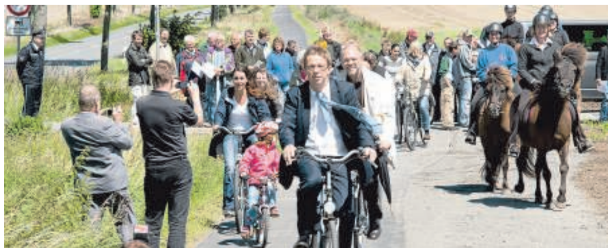
Im August 2012 wurde der Radweg zwischen Heiligendorf und Barnstorf freigegeben. Wolfsburgs Oberbürgermeister Klaus Mohrs radelte vorneweg.